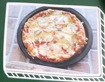
島野菜ピザ(要予約)…1,300円