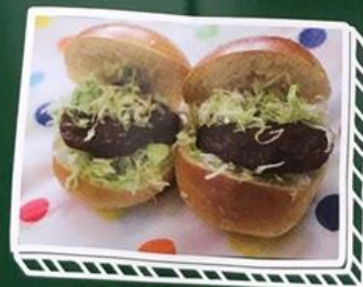
たたきバーガー…220円