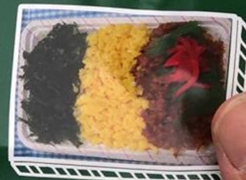
三色弁当…520円 ミニ…390円