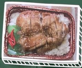
てりやき弁当…550円 ミニ…390円