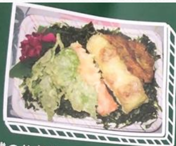
磯のり弁当…540円 ミニ…390円