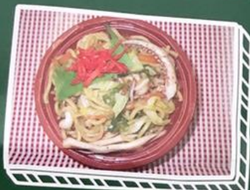
赤いか焼きそば…550円