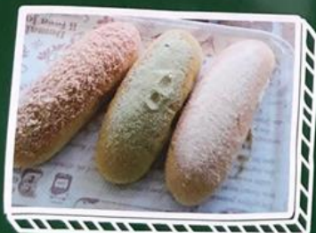
揚げパン(シナモン・明日葉・きなこ)…150円