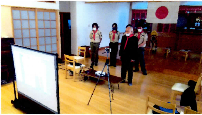
江東2団 初のオンライン集会！ 「B.P 祭」