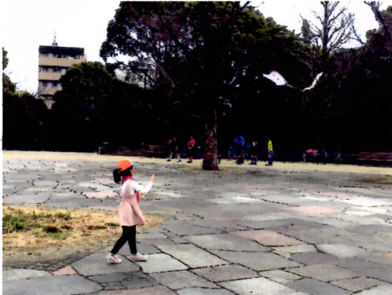
だんだん 上手になりました