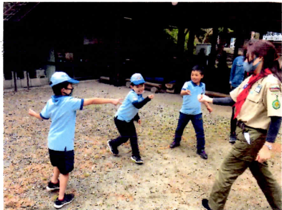
どこでも息づくんがサキ