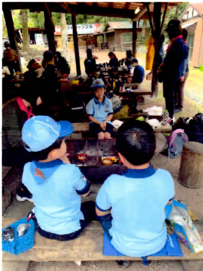
温かいとん汁 おいしかったです。