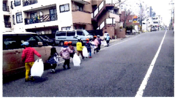
「たこあげ」 絵を描いておいてもらった たこを 仕上げて 揚げました