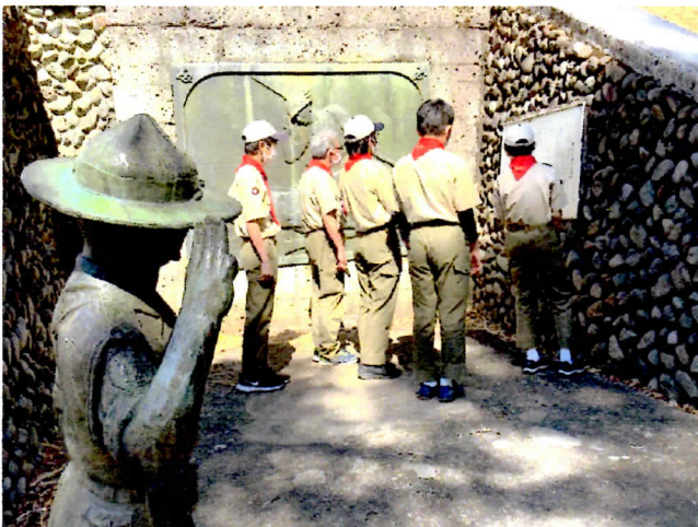
「マンionsカウト像 見学ハイク」