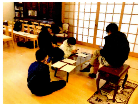
ホーイ ... どちらモ 春季キャンプの計画会議中 ... ベンチャー