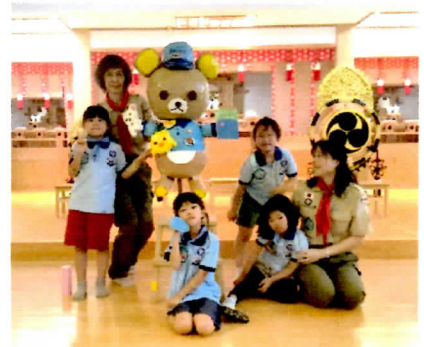
〜リラックマヒーバ〜完成!