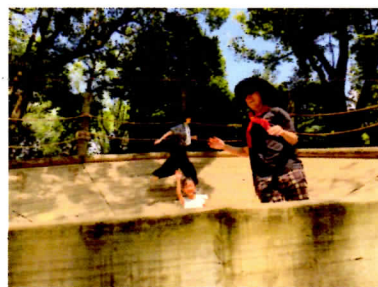
お母さんたちも軽快 3 2.12