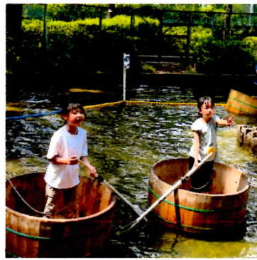
水上コースもクリア!