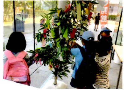
短冊に願いごとを書きました