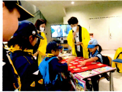
かるたで楽しみながら学習