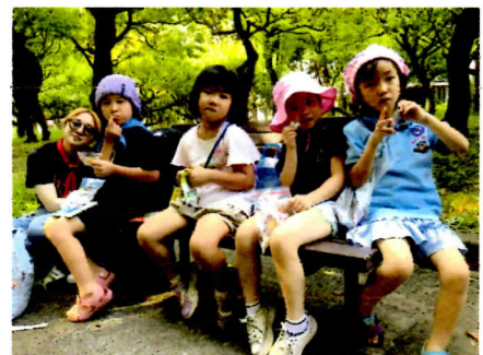
やっぱり楽しいおやつタイム ♪