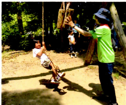
あきらめずに挑戦に成功!