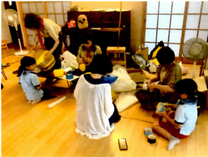
分担してポーツ作り