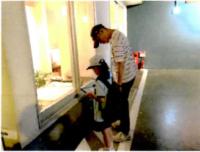
地震後22時間に必要のことを学びました